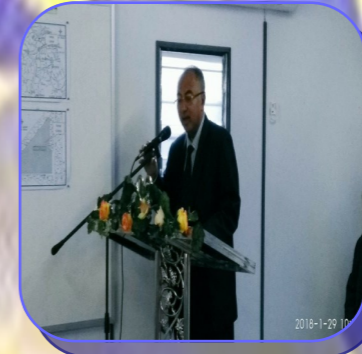
Ucapan oleh Dato' Pengarah JKR Kelantan