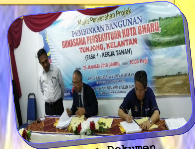
Sesi tandatangan Dokumen Penyerahan Projek

Projek ini adalah projek Rancangan Malaysia Ke-10 yang dirancang pada tahun 2015 lagi dan mendapat kelulusan EPU pada Ogos 2015. Taklimat projek diterima oleh pihak JKR pada Bulan Ogos 2016 dan mula dilaksanakan di tapak pada 1 September 2016 yang melibatkan kerja-kerja pembersihan tapak, kerja-kerja penambakan tanah dan rawatan tanah.